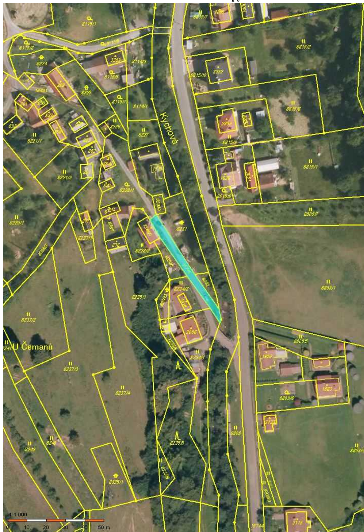
Snímek z katastrální mapy